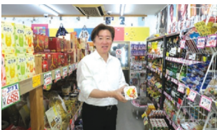
社長おすすめの商品です!

サートチケットを手配することも可能とのこと、苦勞することがあってもお客さんに喜んでほしいという心意気を感じました。前橋市にお越しの際には是非、韓流市場へ足を運んでみてはいかがでしょうか。 【店舗名】 韓流市場 【業態】 食品、日用品販売業 【所在地】 群馬県前橋市千代田町2-17-13 【連絡先】 0271-2371-2682 【サービス内容】 会計から3%割引(お酒以外)(団員証提示者対象) 【メッセージ】 皆様に喜んでいただける商品を取り揃えてお待ちしておりますので、前橋市にお越しの際には、是非韓流市場へお立ち寄りください。全国の消防団員さんの皆様のお越しを心からお待ちしております。