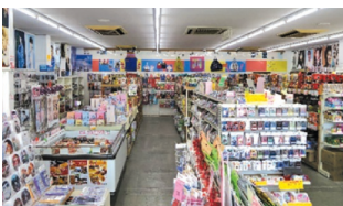
様々な商品が並ぶ店内