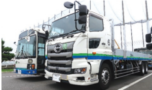
充実した教習車両