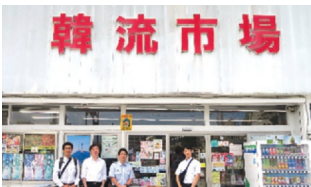
店舗前にて集合写真

お年を召した方々にも喜ばれるもので、高齢の方が小さな孫を連れて来店しても楽しめる商品ラインナップになっています。特に、ビヨット(韓国のヨーグルト)、バズリ菓子、K-POPグッズ、キムチ、ラーメン、土日販売の手作りキンパ、チヂミがお勧めです。インスタフォローするとプレゼントをいただけるサービスも。事前に相談すると、韓国で開催されるK-POPアイドルのコンサート