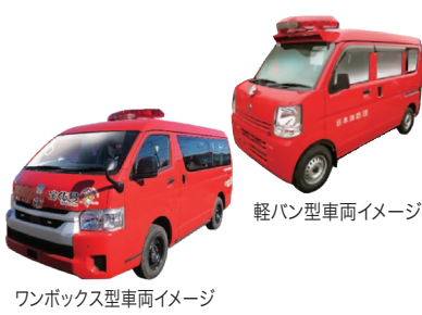
軽バン型車両イメージ