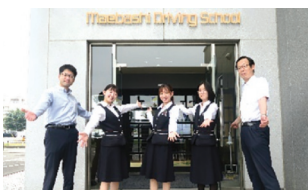
笑顔の素敵なスタッフの皆さん

第一種免許はもちろん、第二種免許やフォークリフト講習等、様々な「安全」教育に力を入れており、単なる免許取得ではなく、安全運転、安全意識の習得にも役立てたい。自動車運転等の安全教育を通して地域に貢献したいという姿勢が強く伝わりました。