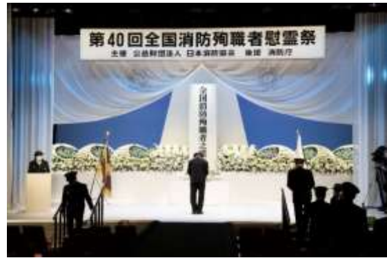
日本消防協会役職員による献花