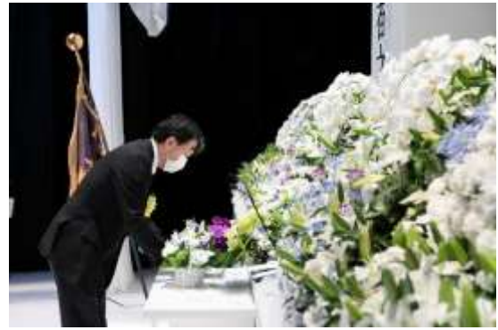
内閣総理大臣代理 大沢内閣官房内閣審議官による献花