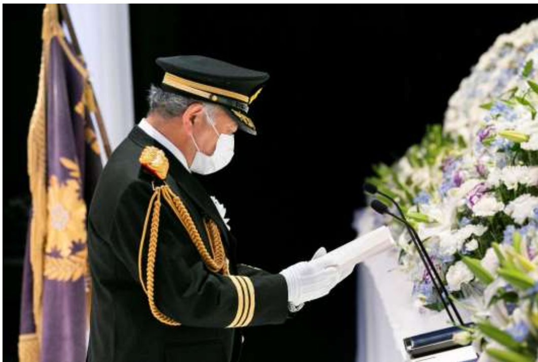
秋本会長による式辞

今回の慰霊祭は、新型コロナウイルス感染症防止対策を徹底するため、全国からのご参列は頂かない異例な形での実施とせざるを得ないこととなりました。また、新しい日本消防会館建設のため、これまでと異なる会場での開催となりました。私どもはそのような状況でありましても、厳粛に慰霊祭を執り行うよう誠心誠意努めさせていただいたところでございます。最後に、新たに合祀する3柱と合わせて5,776柱となる御霊に対し、あらためて敬意を表し、深く感謝しながら、安らかなご冥福を心からお祈り申しあげ、式辞とさせていただきます。