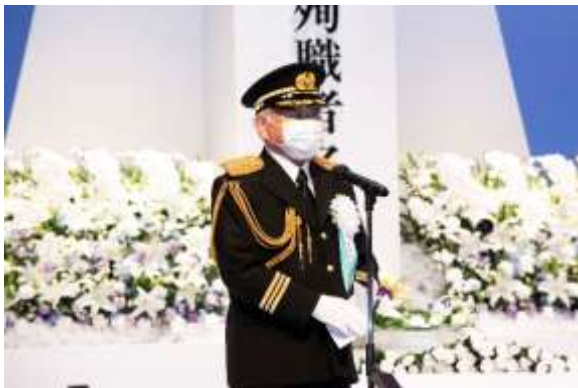
秋本会長あいさつ