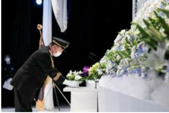
全国消防殉職者遺族会沖山理事 ご遺族を代表するお立場として献花