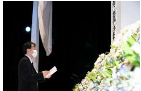
内閣総理大臣代理 大沢内閣官房内閣審議官による追悼のことば