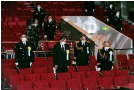
消防殉職者に対する黙とう