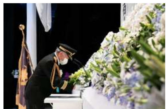
秋本会長による献花