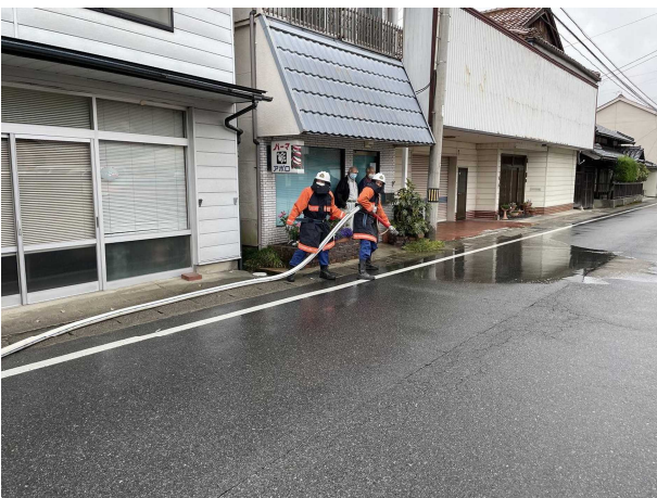
秋季訓練（住宅密集地火災防ぎょ訓練）