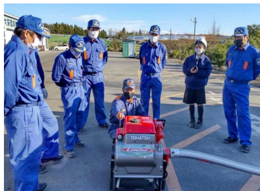
可搬式ポンプ取り扱い訓練