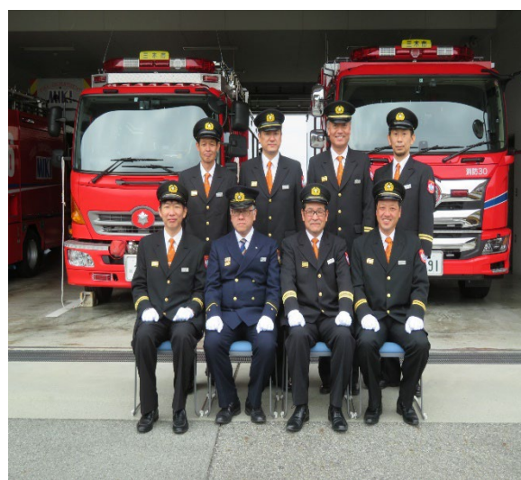
正副団長・消防長