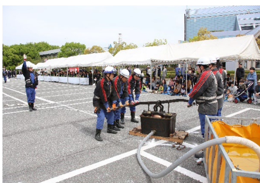
腕用ポンプ放水披露