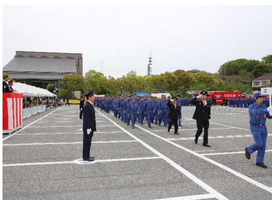
消防団員の部隊行進