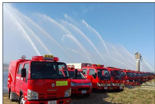
熊谷支部消防特別点検