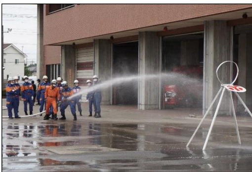
消防団員基礎教育

熊谷市総合防災訓練、消防操法大会、防火広報、普通救命講習、自主防災組織の訓練指導、分団ごとの会議及び訓練等。