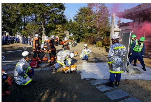
文化財防火デー火災防御演習