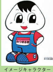
イメージキャラクター みつまる君