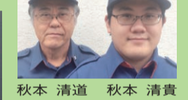
秋本 清道 秋本 清貴

1個140円(税込、送料別) 6個入り900円より ご要望に応じ詰め合わせ可 何か一品サービスいたします。