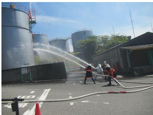
危険物施設防ぎょ訓練