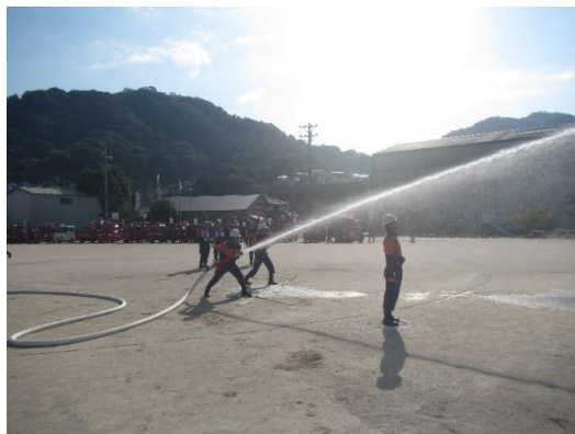
消防競技大会（小型ポンプ）