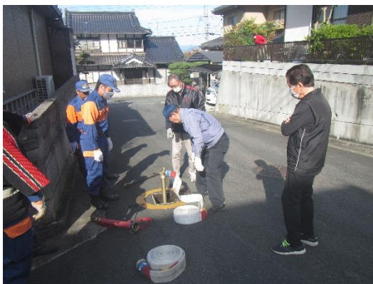
消火栓訓練（地域住民向け）