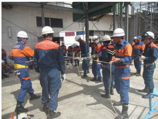
水防訓練・地震防災訓練