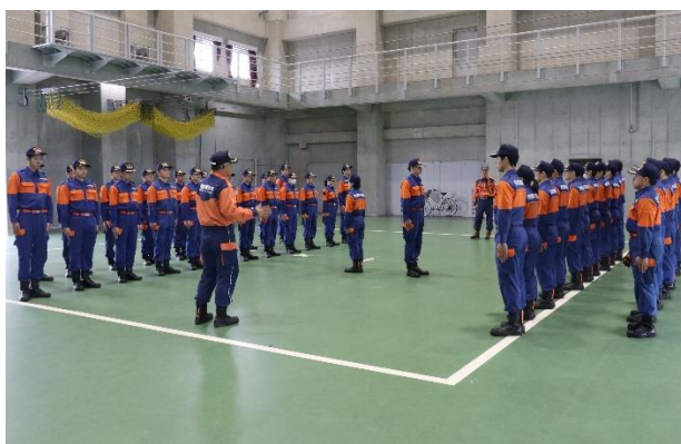
【学生部 1 日入校】