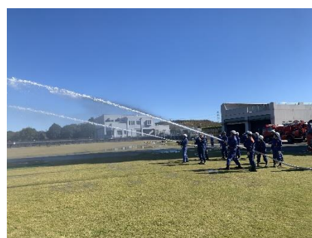
千葉市消防学校で実施されている「基礎教育課程」