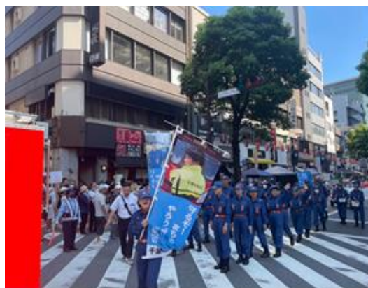
親子三代夏祭りでの消防団PR活動