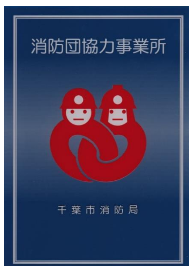
千葉市消防団協力事業所制度