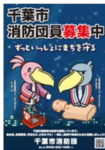
入団促進ポスター