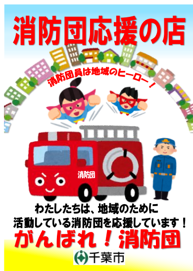
千葉市消防団応援事業所制度