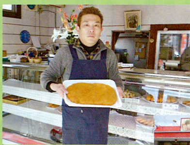
縦20センチ、横30センチ、 重さ約1.4キロ!! 1,000円(税込)

配送はしておりません。 いわきにお越しになる際 に是非ご注文ください。 ※ご注文は2日前までに 要予約です。