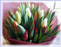
チューリップの花束 10本セット 1,300円から ※発売期間 12月下旬～3月下旬