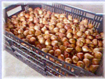
チューリップ球根 イルデフランス 1セット(50球)1,500円など ※ほかにも品種はたくさんありますので お問い合わせください。 ※出荷時期 10月下旬