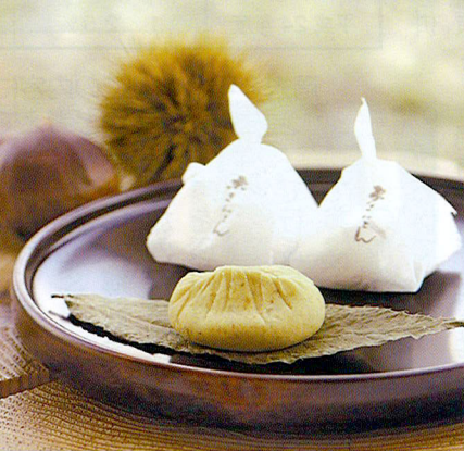
1個220円 6個箱入り1,470円 10個箱入り2,400円(税込、送料別)

ネットでの販売もいたしております。 ホームページ http://www.nitarou.com