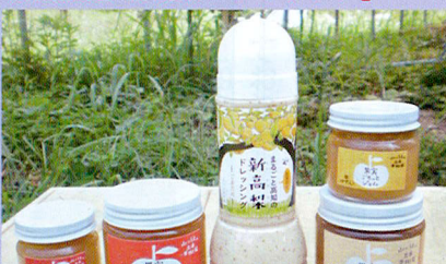
新高梨ドレッシング 300ml 630円 梨、リンゴジャム 180g 500円 ジャムセット 85g×2 500円 (税込、送料別)