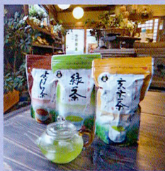
・ティーバッグ各種 (緑茶・ほうじ茶・玄米茶) (各5g×35ヶ) 各種 500円