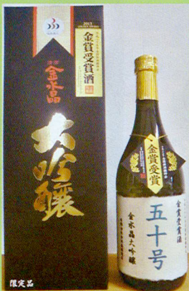
酒造米 山田錦、精米歩合40% 度数17度 酸度1.1 アミノ酸1.0 日本酒度+3 飲みごろ温度 常温または冷やして