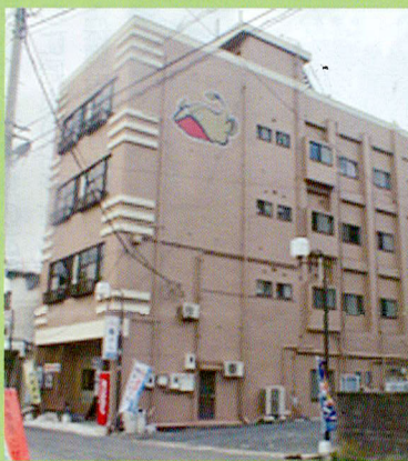
宿泊: 1泊2食……8,550円～ ご宴会料理……4,200円～