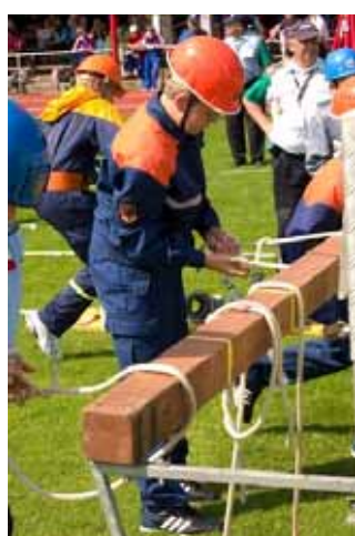
青少年消防競技の風景