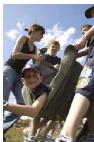
青少年キャンプ活動