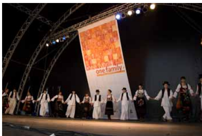
青少年消防大会風景（国自慢）