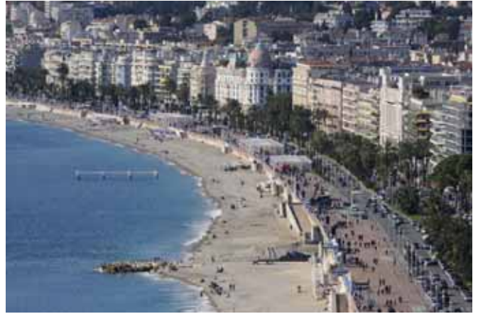
ニースの海岸通り