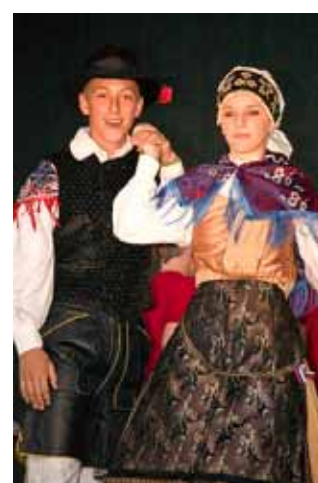
青少年国自慢の風景