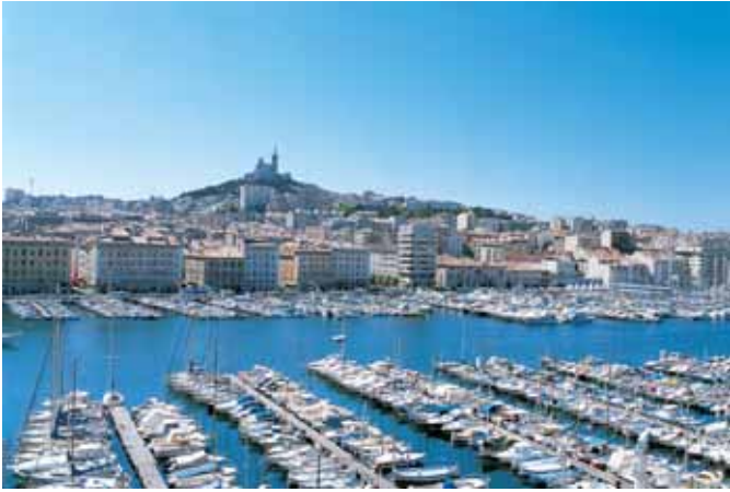
マルセイユ旧港から見たノートル・ダム・ド・ラ・ガルド 寺院