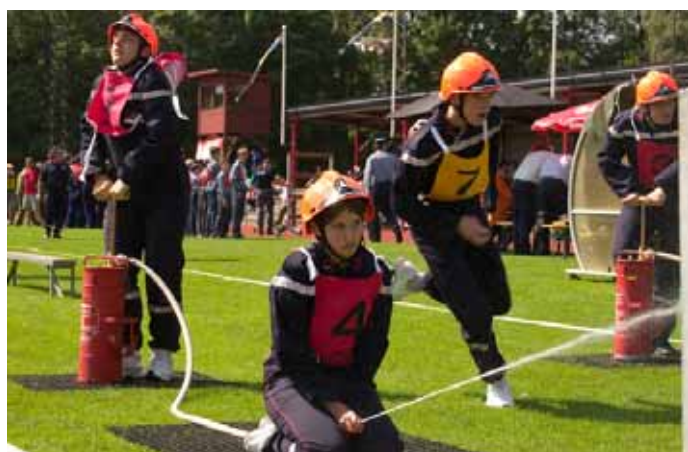
青少年消防大会風景