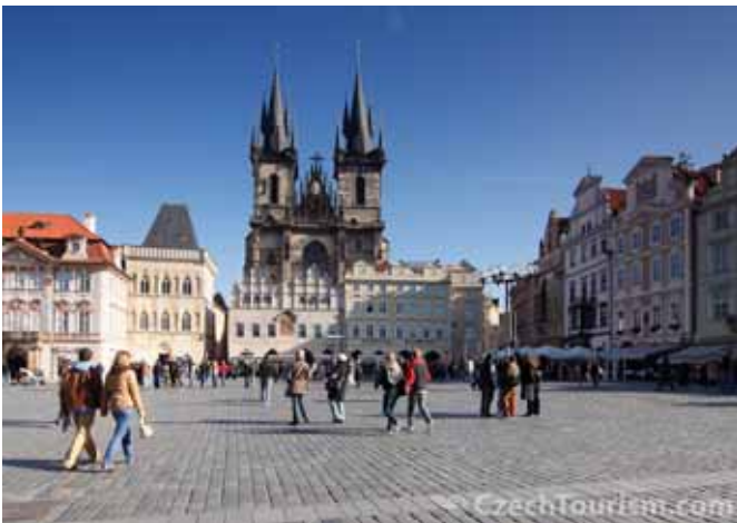
プラハ旧市街広場