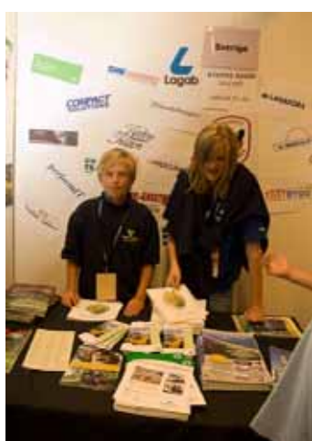
青少年展示ブース