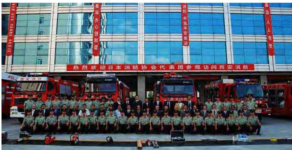
(平成20年中国消防視察の風景 西安市消防局レスキュー隊)