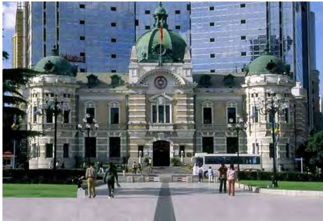
中国銀行大連分行(旧横浜正金銀行)

ち7棟が日本人建築家による設計である。(旧朝鮮銀行大連支店、旧大連民政署(大連警察署)、旧英国領事館、旧大連ヤマトホテル、旧大連市役所、旧東洋拓殖大連支店、旧中国銀行大連支店、旧関東逓信局)