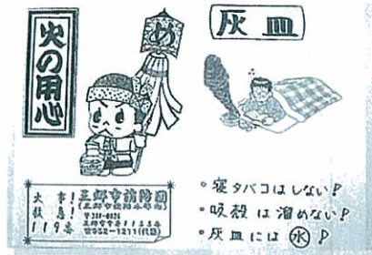
▲ 手作りパンフレット