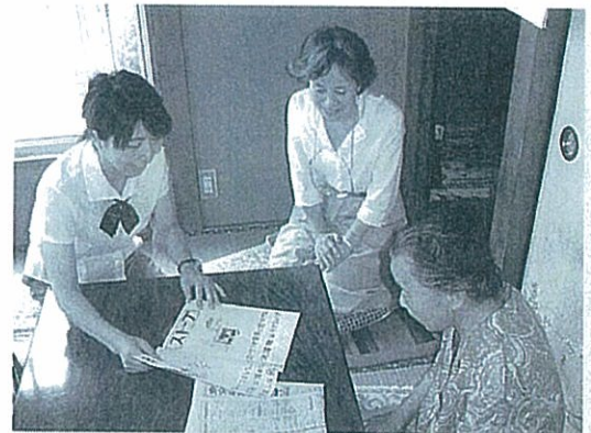
▲ パンフレット説明